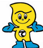
産業廃棄物適正処理のマスコット 「てき丸君」

潤いある未来へ 株式会社 日水コン 〒163-1122 東京都新宿区西新宿 6-22-1 新宿スクエアタワー TEL 03-5323-6200(代) FAX 03-5323-6480