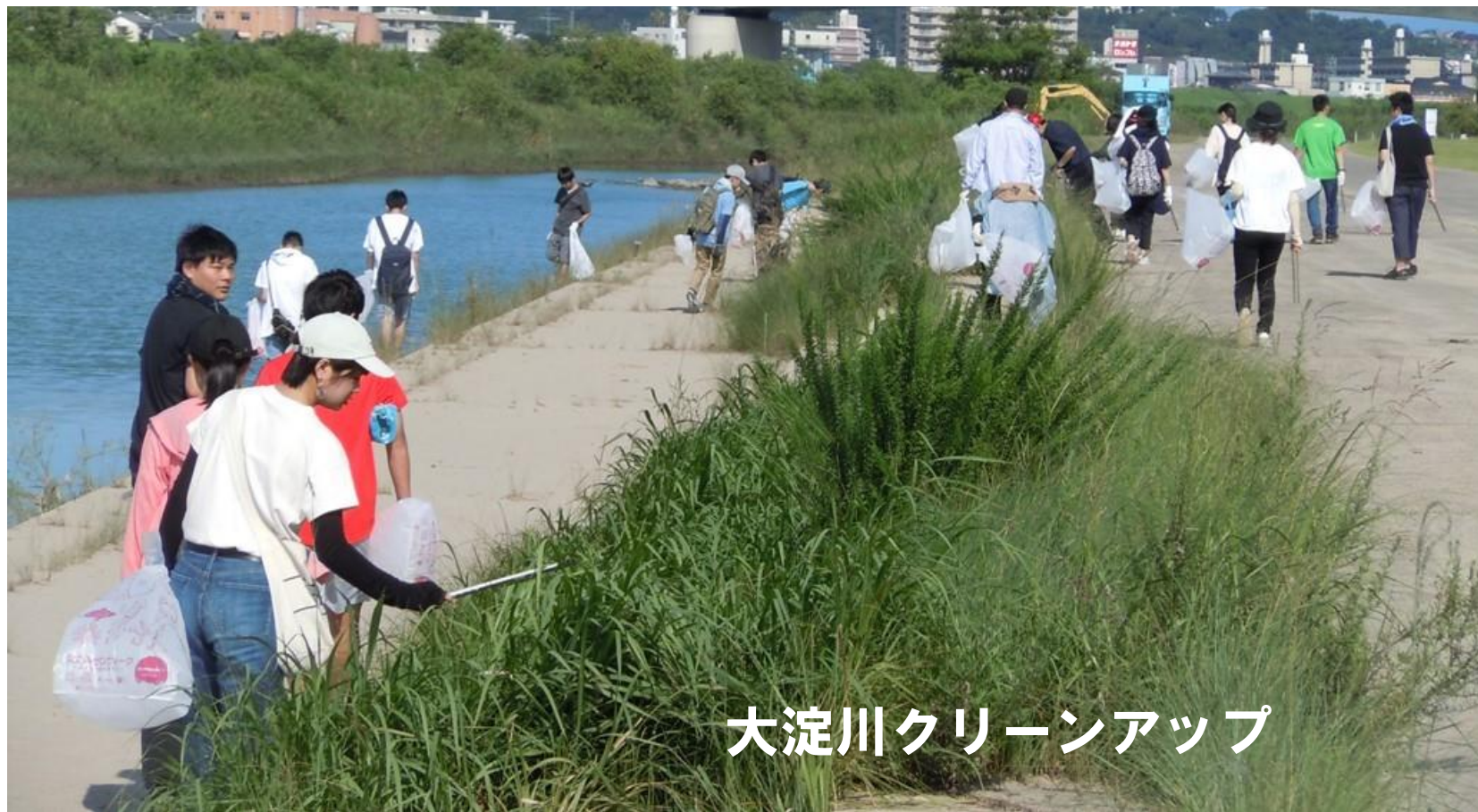
大淀川クリーンアップ