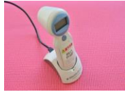
携帯型超音波膀胱容量測定装置 (Bladder Scan EVI6100®) シズメックス社製