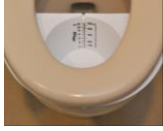
ユーリバン(アズワン社製) 一回排尿量の測定