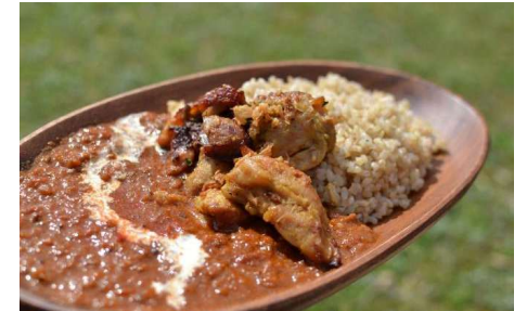
天神祭ごみゼロ大作戦実行委員会