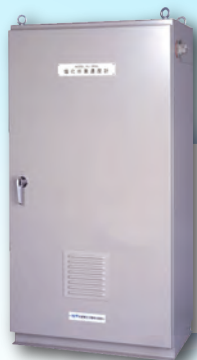
HL-36NS 排ガス中 塩化水素濃度計