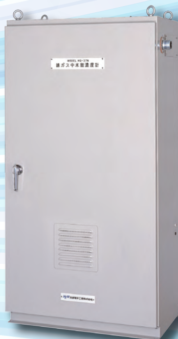
HG-37N 排ガス中 水銀濃度計