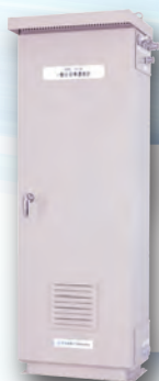
CO-39 排ガス中 一酸化炭素・酸素濃度計