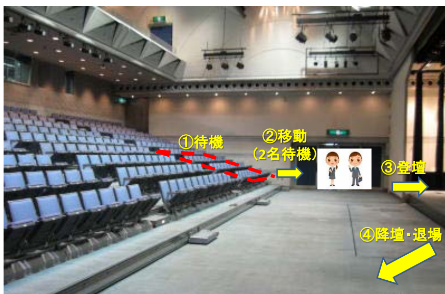
写真 1 Fホールの様子