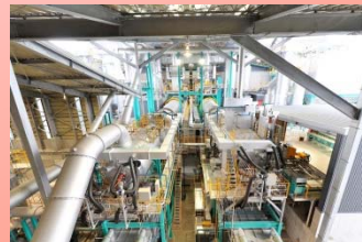
向流型ロータリーキルン式焼却炉