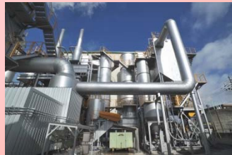
階段水冷ストーカ式焼却炉